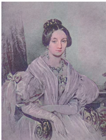
Henrietta Ewa Ankwicz

Nawiązana została zatem więź duchowa pomiędzy obydwojgiem, a dziewczyna opisywała poetę jako „jej ukochanego”. Edward Odyniec zanotował: „Adam od niejakiego czasu jest słodki, miły, rozpromieniony i poetyczny”. Wspominano pewną wiosenną wyprawę do Fiumici-