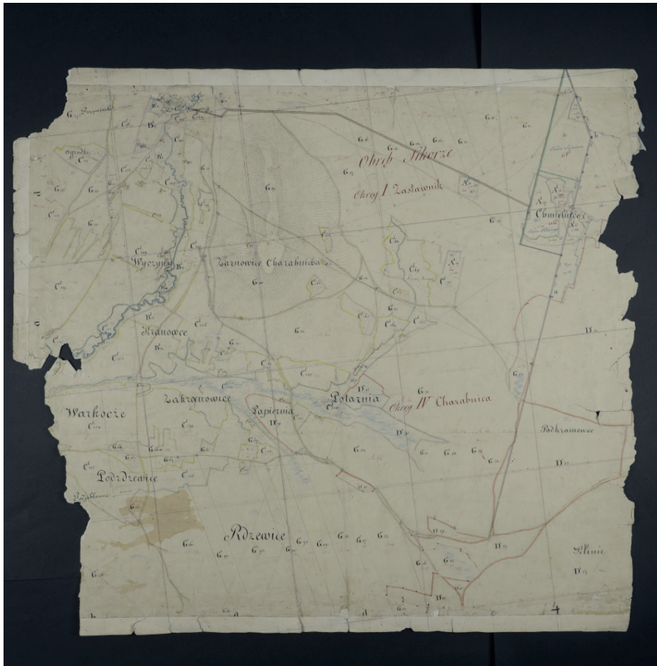
Teren lasu Obrębu Sikorze, z 1829 r. AP w Radomiu, ZDP Kartografia gub. kieleckiej, plany rolne, sygn. 430 - skan 74.

Na nagrobku wymieniono żołnierzy I i II wojny światowej oraz partyzantów AK – i w tym zakresie ludność miejscowa traktuje zapis wyłącznie symbolicznie, jako oddanie tym żołnierzom należnego hołdu.