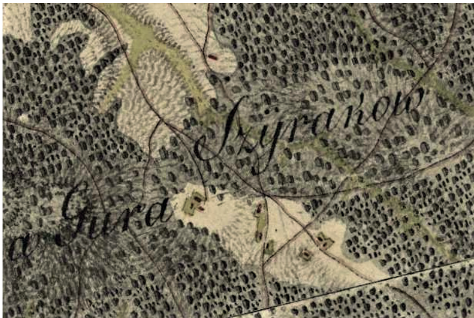
Wieś Sieraków na Mapie Galicji Zachodniej (1804). Wydanie internetowe.

Na mapie Galicji Zachodniej (1804) jej zabudowa zgrupowana przy drodze rodzącej z Daleszyc, a na skraju wsi wschodnim stała karczma. Teren, na którym powstała podlegał administracyjnie kuźnicy w Napękowie, a pod względem przynależności administracyjnej parafii w Daleszycach. Osada stanowiła własność kapituły krakowskiej.