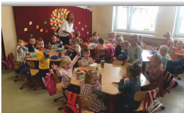
Pierwsze dni przedszkolaków w Szkole Podstawowej w Brzechowie