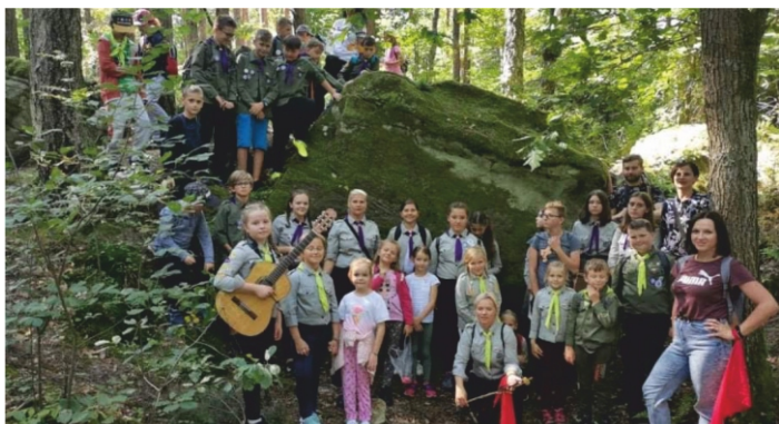
Harcerski Piknik Historyczny w Publicznej Szkole Podstawowej w Marzyszu