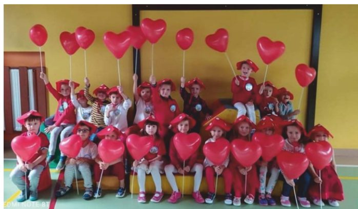
Dzień Przedszkolaka w Zespole Szkolno-Przedszkolnym w Daleszycach