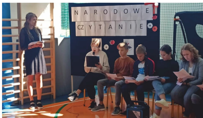
„Narodowe Czytanie” w Publicznej Szkole Podstawowej w Sierakowie