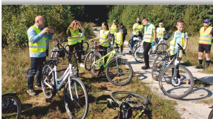
Rajd rowerowy w Publicznej Szkole Podstawowej w Szczecnie