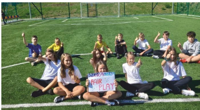
Światowy Dzień Fair Play w Szkole Podstawowej w Mójczy