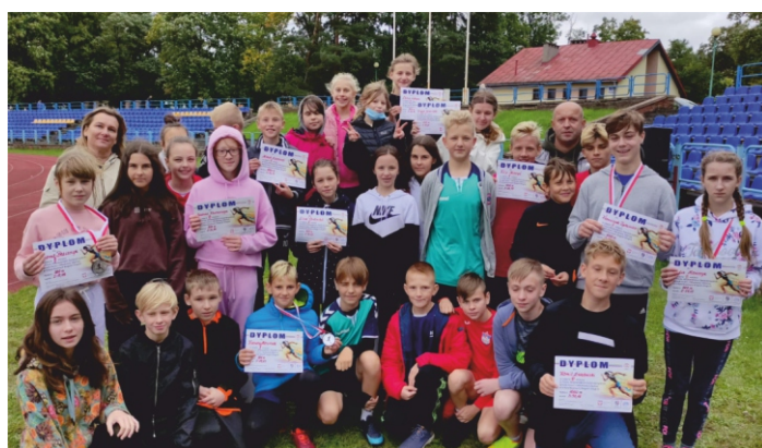
Udany początek sezonu sportowego dla uczniów Szkoły Podstawowej w Daleszycach