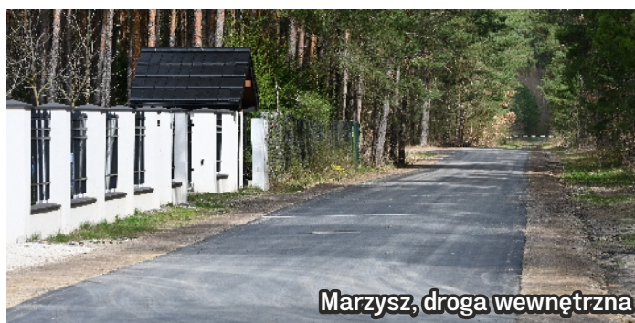
Marzysz, droga wewnętrzna