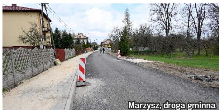
Marzysz, droga gminna