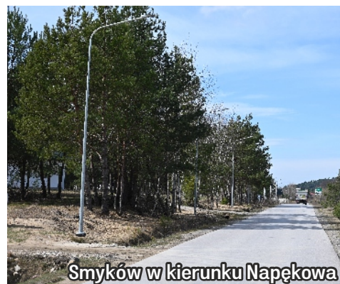
Smyków w kierunku Napękowa