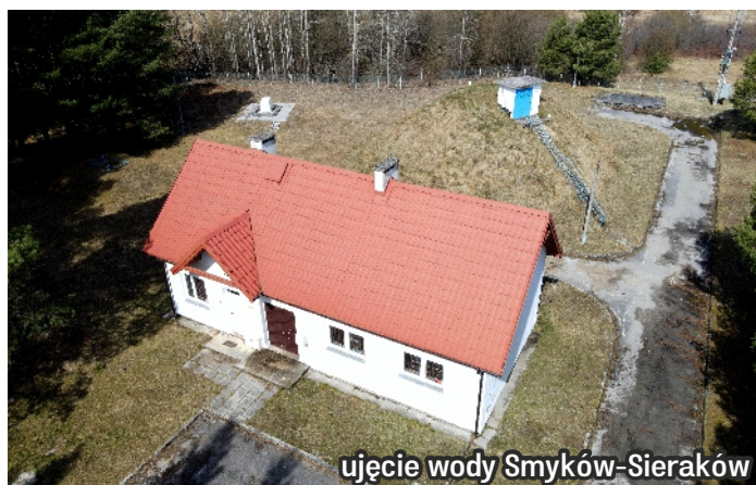
ujęcie wody Smyków-Sieraków