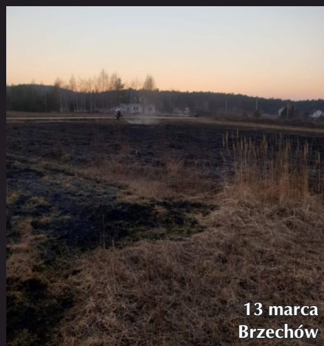
13 marca Brzechów