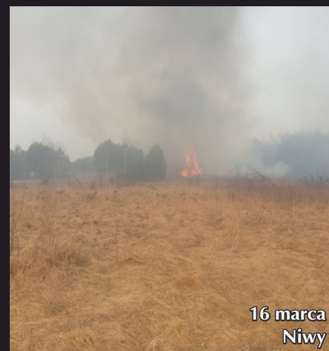
16 marca Niwy