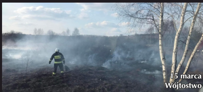
15 marca Wójtostwo