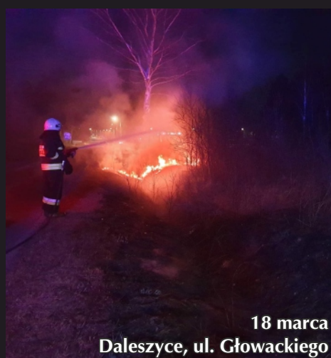
18 marca Daleszycy, ul. Głowackiego