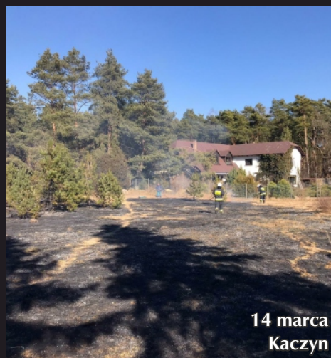
14 marca Kaczyn