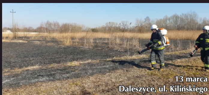
13 marca Daleszycy, ul. Kilińskiego