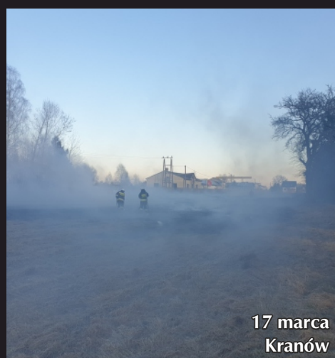
17 marca Kranów