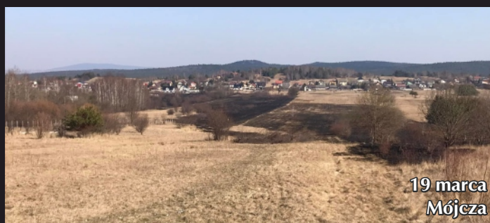
19 marca Mójcza