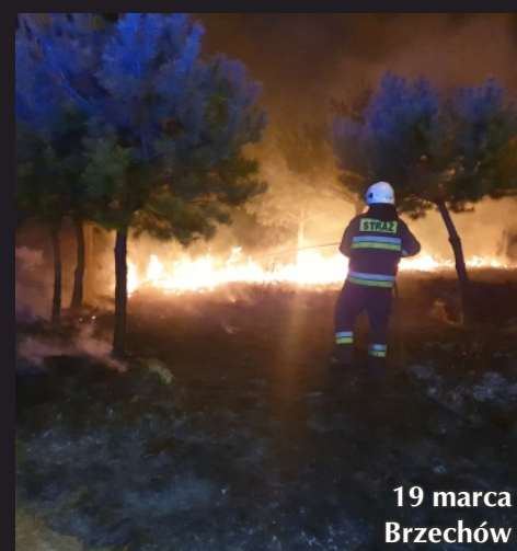
19 marca Brzechów