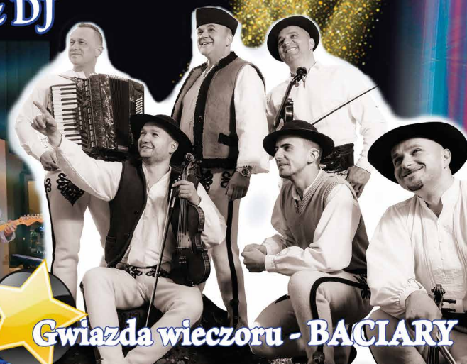
Gwiazda wieczoru - BACIARY