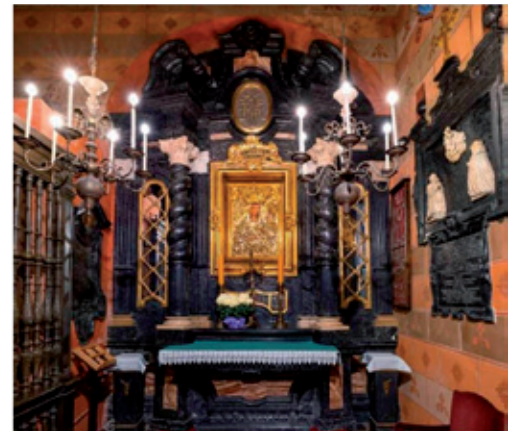
Kaplica Matki Bożej Loretańskiej

Ziemią Świętokrzyską, a wydaje się, że jeszcze słyhać tam szept modlitwy i ceremonialne śpiewy pogrzebowe: „ O Pośredniczko rzuć swe wejrzenie łaskawe na nas. Przyjmij westchnienie, pokaż nam Matko Syna Twego w górnej krainie, Salve Regina ”.