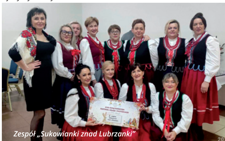
Zespół „Sukowianki znad Lubrzanki”