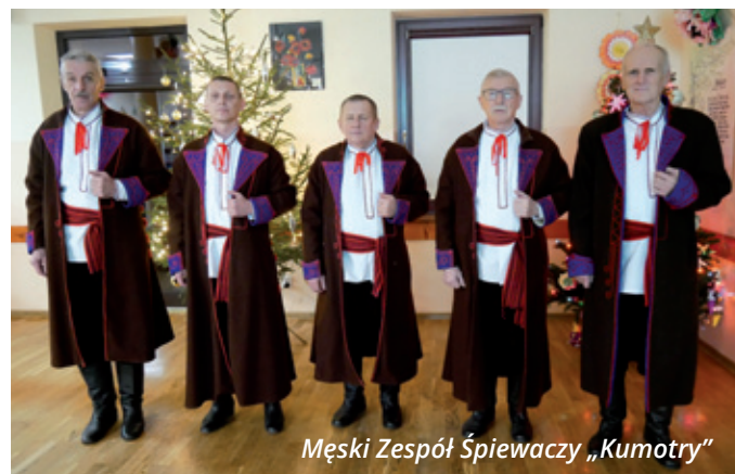
Męski Zespół Śpiewaczy „Kumotry”