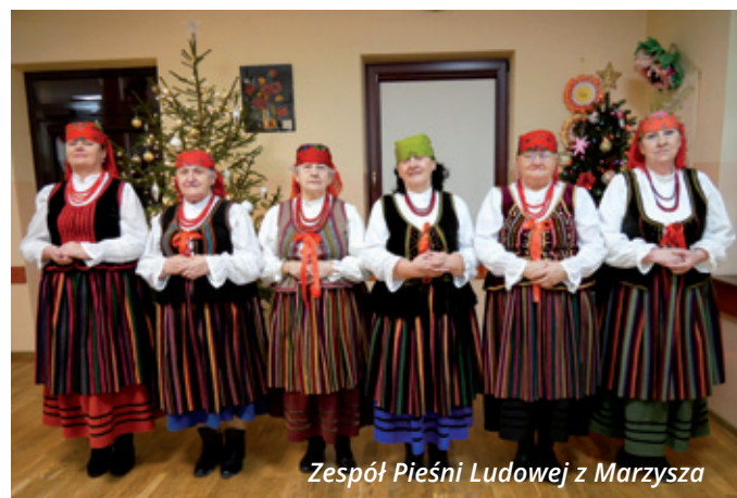
Zespół Pieśni Ludowej z Marzysza

W niedzielę 26 stycznia po raz 33. zagra Wielka Orkiestra Świątecznej Pomocy! Mieszkańcy naszej gminy jak zawsze chętnie dołączają do największej na świecie orkiestry. Serdecznie zapraszamy do hali ZSP w Daleszycach! O 15:30 wystąpią dla Was nasi wspaniali artyści, natomiast o 17:00 rozpoczniemy pełną emocji licytację!