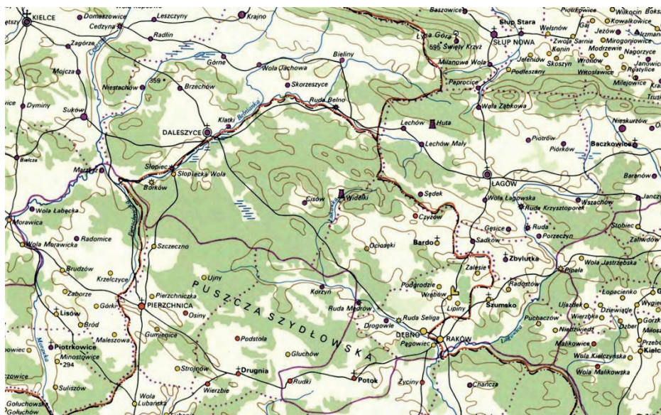
Dobra Szczecno na mapie Polska XVI w., widoczne wsie Szczecno i Ujny, ale brak jest osady Trzymosna, za: Atlas Historyczny Polski. Województwo sandomierskie w drugiej połowie XVI wieku , cz. 2. Komentarz, Indeksy. Mapy, Warszawa 1993.

Nie znamy czasu powstania osady. Powstała zapewne w końcu XV w. -choć Księga Uposażeń Jana Długosza w połowie XV w. jej nie wymienia. Pierwsza wzmianka na jej temat pochodzi z czasów zatargów pomiędzy właścicielami dóbr Szczecno a starostą szydłowskim, dotyczącej podatku zwanego „stacją”, płaconego przez poddanych dóbr królewskich. W tej sprawie w dniu 17 XI 1488 r. król rozsządził spór pomiędzy starostą szydłowskim Mikołajem z Kurozwęk, a Mikołajem Borkiem herbu Wąż o stację z posiadłości Szczecno, Ujny i Trzymosna 4 . Dobra te znajdowały się na terenie starostwa szydłowskiego, parafii pierzchnickiej 5 .