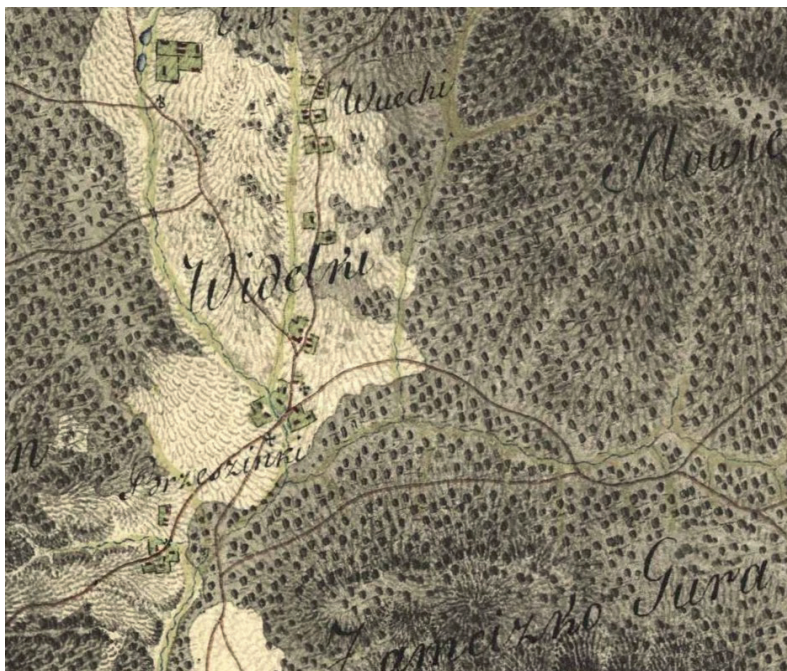
Wieś Widelki oraz Góra Zamczysko nr 2 na Mapie Galicji Zachodniej (1804, za: https://maps.arcanum.com , data pobrania 21/05.2021 r.

Według Mapy Galicji Zachodniej (1804) zabudowa wiejska stała przy drodze do Makoszyna. W części południowej, drogi lokalne schodziły się w jedną prowadzącą w stronę Brzezinek, a na skrzyżowaniu dróg stała karczma. Kilka budynków na północny określono jako Wuiecki , a w części Zarobiny , znajdował się zespół budynków stojących na dwóch, prostokątnych działkach, zajętych pod ogrody.