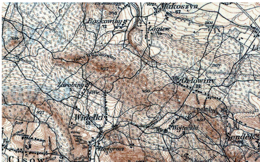
Wieś Widelki na mapie austroęgierskiej z 1914 r.